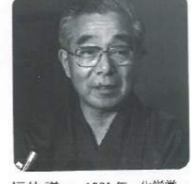
福井 謙一 1981年 化学賞 化学反応の過程を追及。 Fukui Kenichi: Study of chemical reactions.