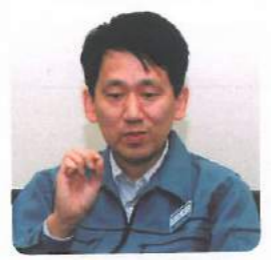
田中 耕一 2002年 化学賞 会社研究員として初。蛋白質分析。 Tanaka Kohichi: First winner as company employee. Analytic apparatus for protein.