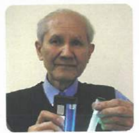
下村 脩 2008年 化学賞 クラゲから緑色発光体発見。 Shimomura Osamu: Discoverer of green fluorescent protein in jellyfish