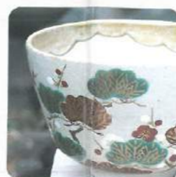
清水焼 Kiyomizu ware