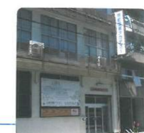
京都国際アカデミー KYOTO INTERNATIONAL ACADEMY of Japanese Language