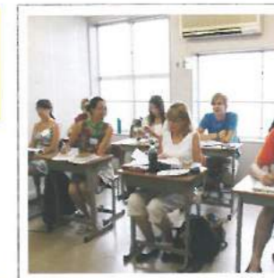
明るく快適な教室 Phòng học đầy đủ trang thiết bị

Những phòng học đầy đủ trang thiết bị, môi trường tự học hấp dẫn, ký túc xá thuận tiện, Kyoto Academy luôn nỗ lực nâng cao chất lượng học tập và sinh hoạt của học sinh.