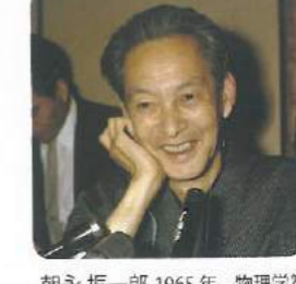
朝永 振一郎 1965年 物理学賞 量子電気力学の確立。 Tomonaga Sinichiro: Influential in developing quantum electronic mechanics