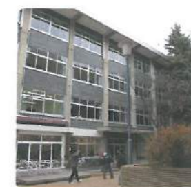
大谷大学 Ohtani Univ.