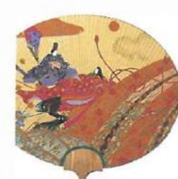
京うちわ Kyo round fan