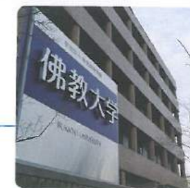
佛教大学 Bukkyo Univ.