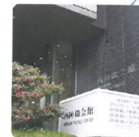
西陣織会館 Nishijin Textile Center