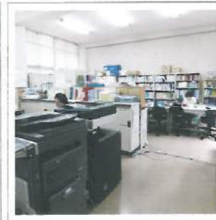
スタッフ事務室 Phòng cho giáo viên