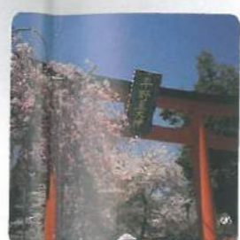
平野神社 Hirano Shrine