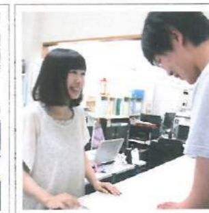
語学堪能な優しい受付スタッフ Nhân viên vui vẻ, hòa đồng, giỏi ngoại ngữ