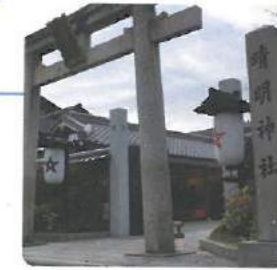
晴明神社 Seimei Shrine