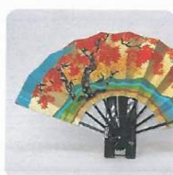
京扇子 Kyo folding fan