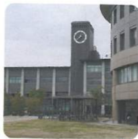
立命館大学 Ritsumeikan Univ.