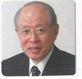
野依 良治 2001年 化学賞 キラル触媒の不斉反応で功績。 Noyori Ryoji: For the study of asymmetric reactions of chiral catalysts.