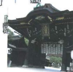
北野天満宮 Kitano tenman-gu