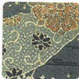
西陣織 Nishijin fabrics