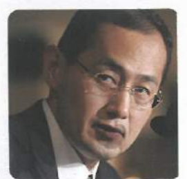
山中 伸弥 2012年生理学・医学賞 iPS細胞の発見。 Yamanaka Shinya: Discoverer of the iPS cell

Many Nobel Prize winners in the division of natural science studied or worked near Imadegawa Street.