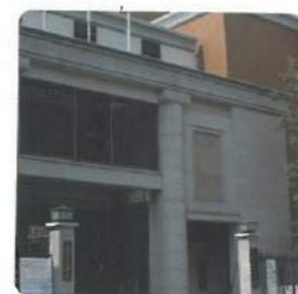
花園大学 Hanazono Univ.