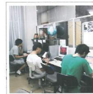
ネット環境の整った自習室 Phòng tự học được trang bị Internet