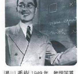
湯川 秀樹 1949年 物理学賞 中間子の発見。日本人で初めて。 Yukawa Hideki: Discoverer of pi mesons. First Japanese Nobel Prize winner.