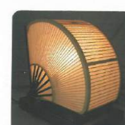
竹細工 Bamboo work