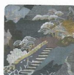
つづれ織り Handwoven tapestry