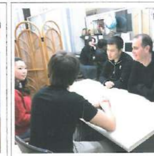
自由に利用できる談話室 Phòng nghỉ giải lao