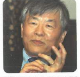
利根川 進 1987年 生理学・医学賞 抗体の遺伝子を解明する。 Tonegawa Susumu: Discovery of the gene which produces antibody diversity.